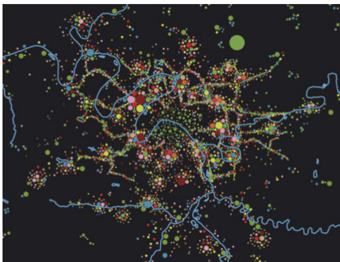
Proyectos de pequeña, mediana y gran escala para la ciudad y por los ciudadanos de la ciudad.

Crear nuevas conexiones concéntricas que vinculen las diferentes redes urbanas con los centros de la periferia para complementar y reforzar el sistema radial existente.